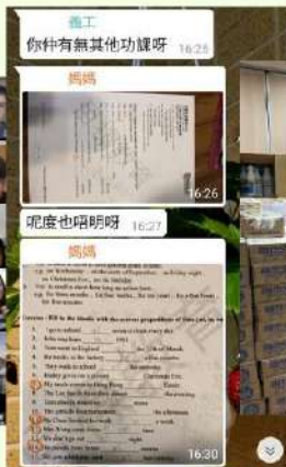
♥ 停課不停學 青年義教