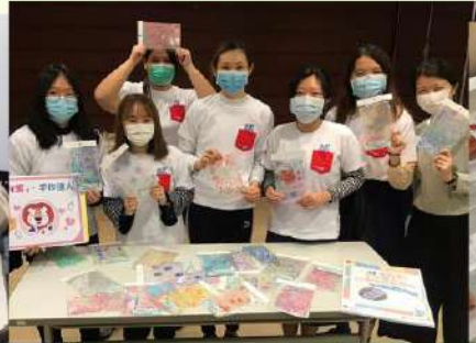
♥ 製作不同防疫用品 包括: 皮口罩帶及口罩套