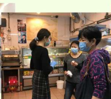
♥ 區內派發物資及關心鄰里