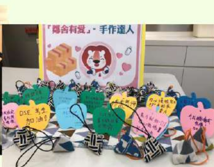
♥ 縫製DSE考生舒壓香包