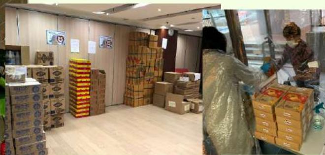
♥ 派發糧油食品及防疫用品 給區內有需要人士